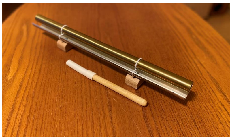
Obr. č. 4: Vibrafon 528 Hz